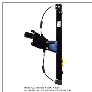
ORIGINAL POWER WINDOW LEFT ALZACRISTALLI ELETTRICO-ORIGINALE SX

Lève-vitre d'origine / Original-Fensterheber Alzacristalli originale / Elevavinas original