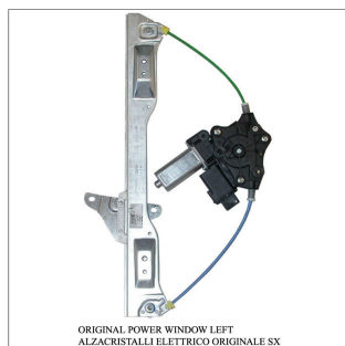
ORIGINAL POWER WINDOW LEFT ALZACRISTALLI ELETTRICO ORIGINALE SX

Lève-vitre d'origine / Original-Fensterheber Alzacristalli originale / Elevavinas original