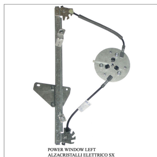
POWER WINDOW LEFT ALZACRISTALLI ELETTRICO SX

Lève-vitre de remplacement / Ersatz-Fensterheber Alzacristalli di ricambio / Elevavinas de recambio