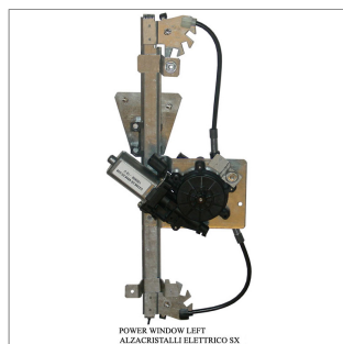
POWER WINDOW LEFT ALZACRISTALLI ELETTRICI SX

Lève-vitre de remplacement / Ersatz-Fensterheber Alzacristalli di ricambio / Elevavinas de recambio