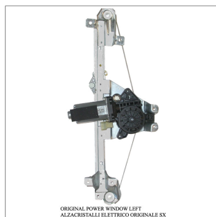
ORIGINAL POWER WINDOW LEFT ALZACRISTALLI ELETTRICI ORIGINALE SX

Lève-vitre d'origine / Original-Fensterheber Alzacristalli originale / Elevavinas original