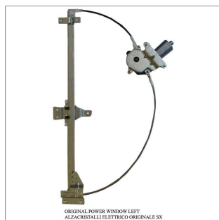
ORIGINAL POWER WINDOW LEFT ALZACRISTALLI ELETTRICI ORIGINALE SX

Lève-vitre d'origine / Original-Fensterheber Alzacristalli originale / Elevavinas original