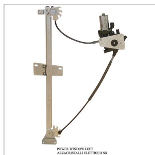
POWER WINDOW LEFT ALZACRISTALLI ELETTRICI SX

Lève-vitre de remplacement / Ersatz-Fensterheber Alzacristalli di ricambio / Elevavinas de recambio