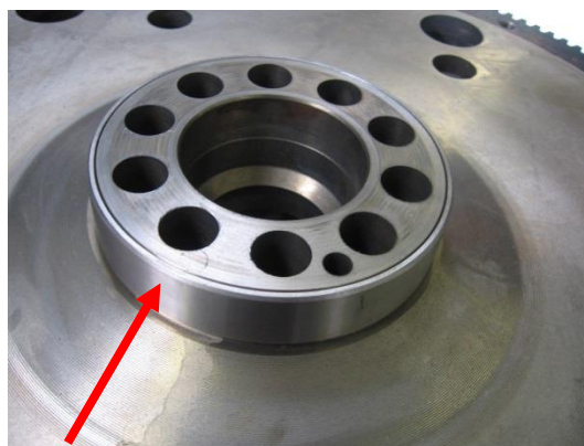
Volante com anel do rotor