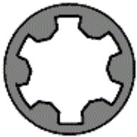
152.760 M 12x1,25x218

Anziehreihenfolge/Tightening sequence/Ordre de serrage/Orden de apriete