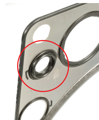
61-37770-00_Ressalto vedante 3 mm mais alto