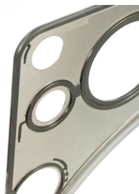
61-34285-20_Ressalto vedante plano