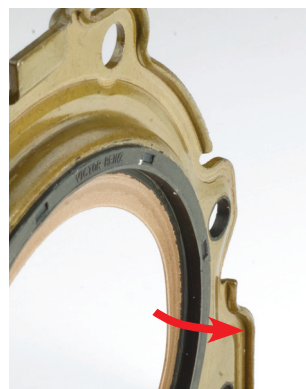
Рис. 1 Рабочая кромка указывает на редуктор

Обязательно соблюдать прилагаемую инструкцию по монтажу уплотнительных колец PTFE.