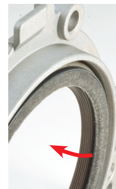
Рис. 2 Рабочая кромка указывает на внутреннюю сторону двигателя