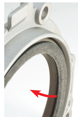
Abbildung 2 _Dichtlippe zeigt zum Motorinneren