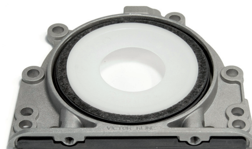
Ilustracja 2_Strona dolna zintegrowanego pierścienia uszczelniającego wału

VICTOR REINZ - doskonała droga do nowej uszczelki.