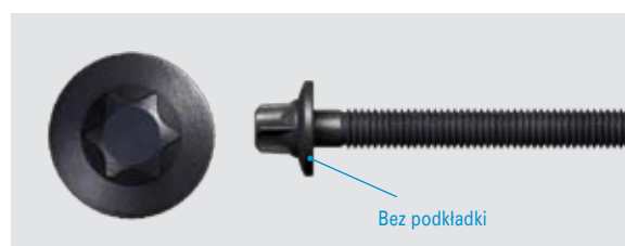
Rys. 2_Nowa śruba bez podkładki (nr OE 65 07 937)