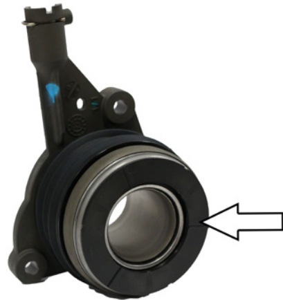
Afb. 1: Nieuwe CSC-versie 510 0235 10/11/12 met kunststof drukring

Art.nr. nieuwe versies: 510 0235 10 510 0235 11 510 0235 12