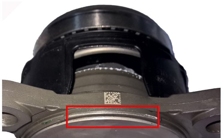
Afbeelding 2: Beschadigingspatroon van een centrale ont koppeling met geloste afdichtingsschijf