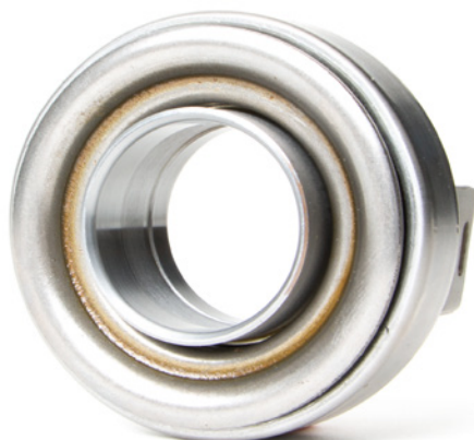
Figura 1: sui cuscinetti di disinnesto frizione con boccole in metallo deve essere applicato del lubrificante

Osservare le indicazioni del costruttore del veicolo!