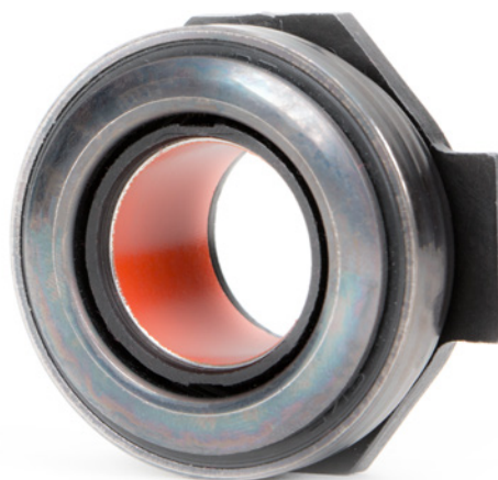
Figura 3: sui cuscinetti di disinnesto frizione con boccole in PTFE non deve essere applicato il lubrificante