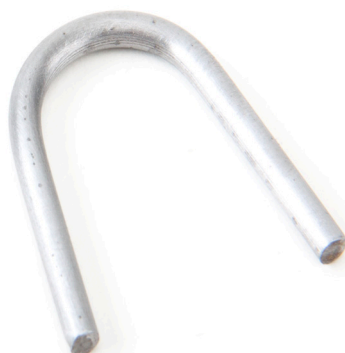
Снимка 1: Телен фиксатор

Фрикционните дискове, изброени по-горе, не могат да бъдат използвани в комбинация с използвани притискателни дискове, освен ако последния първо се закрепят с 4 телени фиксатора (снимка 1) преди демонтаж. Това се отнася до всички съединители от издърпващ тип, независимо от производителя, с диаметър на притискателния диск от 430 мм и плоски/равни палци на диафрагмената пружина.