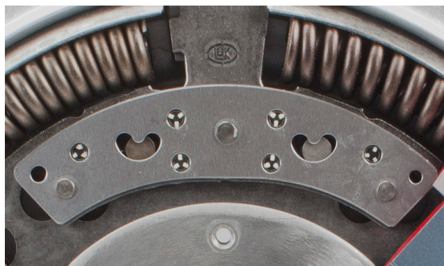
Fig. 2: Pendul pentru reducerea forței centrifuge

Zgomotele care se produc când se acționează cu mâna volantul cu masă dublă se datoresc construcției, nu sunt un defect!