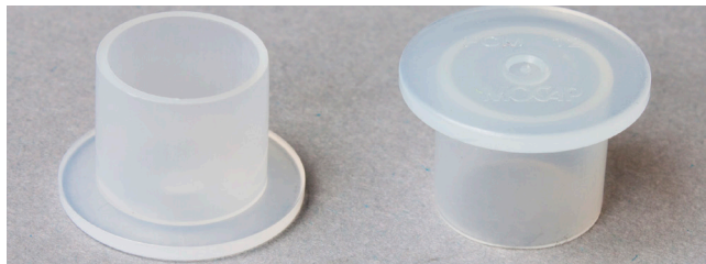
Fig. 2: Garnituri temporare

unitatea mecatronică și pe cutia de viteze (vezi Fig. 1). După montare, înlocuiți ambele garnituri temporare cu cele permanente.