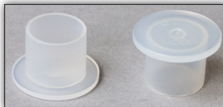
Fig. 2: Afsluitdoppen

Om olieverlies bij het demonteren van de transmissie te voorkomen, worden bij elk LuK tweedelig vliegwiel en bij elke LuK RepSet®2CT twee afsluitdoppen meegeleverd. Deze moeten, terwijl de transmissie nog is gemonteerd, op de plaats van de zwarte ontluichtingsdoppen van Mechatronic en transmissie worden aangebracht (zie Fig. 1). Na de montage moeten beide afsluitdoppen worden verwijderd en moeten de ontluichtingsdoppen weer worden aangebracht.