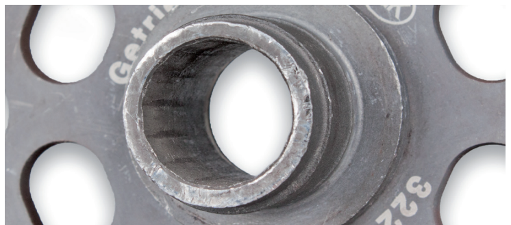
Fig. 2: Perfil del buje dañado

Esta anomalía también puede llegar a dañar los dientes del estriado del disco, llegando incluso a comer dichos dientes por completo (ver fig. 2).