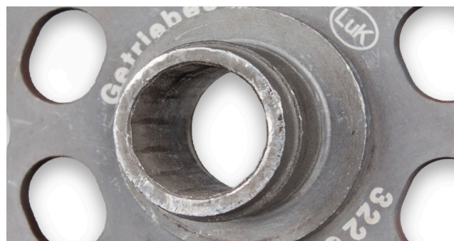
Снимка 2: Повреден профил на шлиц

Ако това се случи, DMF може да не функционира правилно. Всички ротационни вибрации на двигателя се предават към скоростната кутия/задвижващия привод, без при това да са смекчени, което води до възникване на шумове и на преждевременно износване. В отделни случаи, профилът на шлиците на фрикционния диск може да бъдат повредени поради този процес; в този случай, няма да се предава мощност (виж снимка 2).