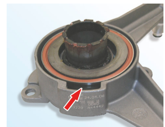
Зображення 3: Правильно