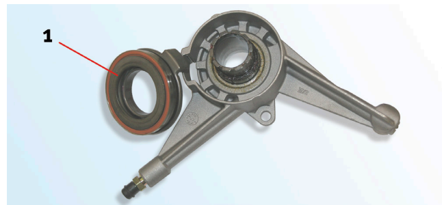
Зображення 1: 510 0016 10

Під час встановлення витискного підшипника необхідно переконаватися в тому, що опорний підшипник (1) повернутий плоским боком до зчеплення!