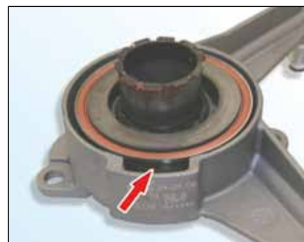
Slika 3: Pravilno