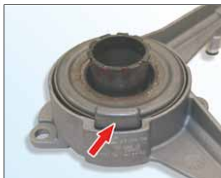
Slika 2: Napačno