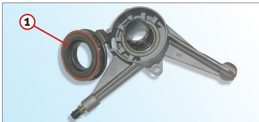
Figuur 1: 510 0016 10.

Zorg ervoor dat bij het monteren van het hydraulisch druklager de platte zijde van het druklager in de richting van de koppeling wordt gemonteerd. (Figuur 1).