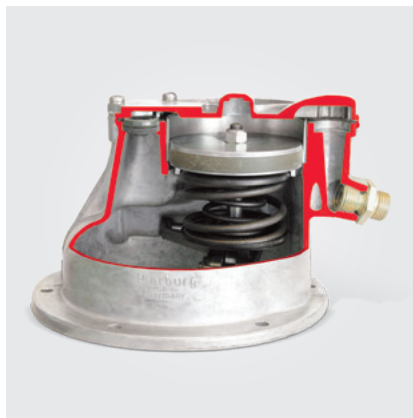
Una classica pompa per vuoto a pistoni (modello in sezione)