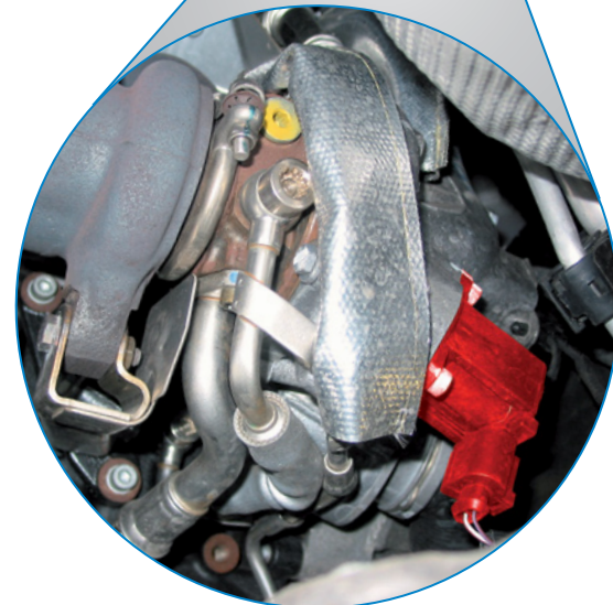
Válvula de desvio de ar no VW EOS TFSI (destacada a vermelho)