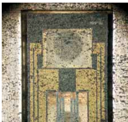
Salt och smuts kan skada sensorn på en luftmassasensor – eller åtminstone förfalska mätningarna, vilket i sin tur kan påverka EGR.