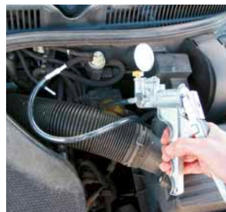
Om pneumatiska EGR-ventiler eller som här en EPW: funktionen kan lätt kontrolleras med en handvakuumpump.