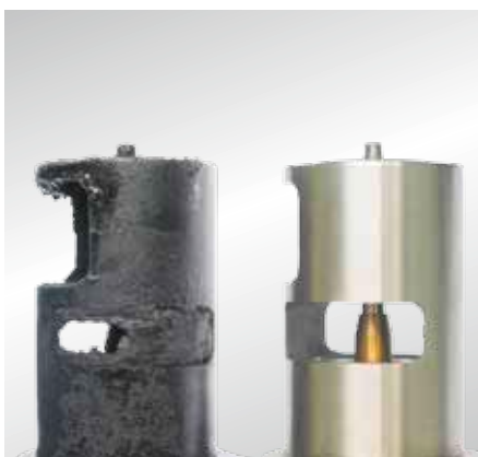
Supapele EGR nu se pot înnegri de la sine cu funingine, de aceea trebuie determinată cauza formării funinginii.