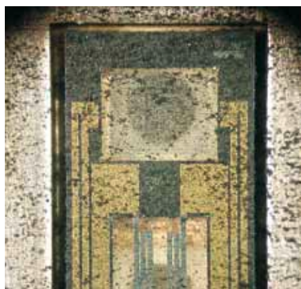
Sarea și impuritățile pot deteriora senzorul unui senzor de masă de aer – sau cel puțin pot cauza măsurători greșite, iar datele eronate vor avea la rândul lor efect asupra EGR.