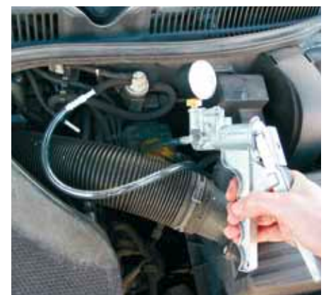
Și în cazul supapelor AGR, și la sistemele cu traductor electro-pneumatic (EPW), ca de exemplu cel de față: funcționalitatea se poate verifica ușor cu pompa manuală de vid.