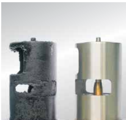
Καθώς οι βαλβίδες EGR δεν μπορούν να γεμίσουν αιθάλη μόνες τους, πρέπει να αναζητηθεί η αιτία της συσσώρευσης αιθάλης.

Ένα ελαττωματικό εξάρτημα θα πρέπει να αντικαθίσταται πάντα με ένα καινούργιο.