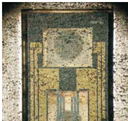
Το λάτι και οι ρύποι ενδέχεται να προξενίσουν ζημιά στον αισθητήρα του αισθητήρα μάζας αέρα – σε κάθε περίπτωση ωστόσο αλλοιώνουν τις μετρήσεις κάτι που πάλι μπορεί να επιδράσει στην EGR.