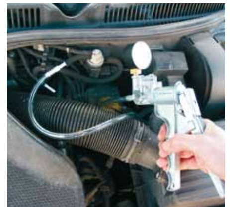
Είτε πρόκειται για πνευματικές βαλβίδες EGR είτε όπως εδώ για μία EPW: η λειτουργία μπορεί να ελεγχθεί εύκολα με μία χειραντλία κενού.