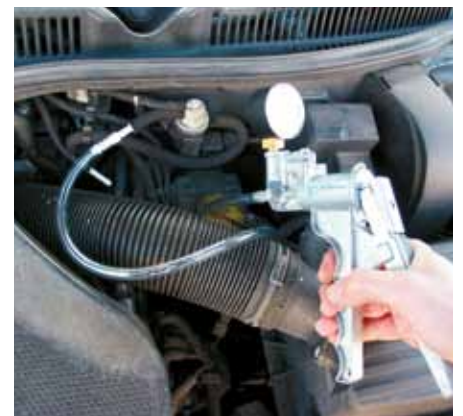
Hvad enten det drejer sig om EGR-ventiler eller en EPW som her: Med en håndpumpe for undertryk kan funktionen nemt kontrolleres.