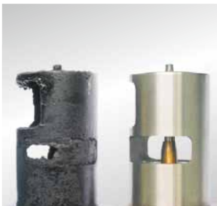
Da EGR-ventilerne ikke kan sode sig selv til, skal årsagerne til soden findes.

En defekt komponent bør altid udskiftes med en ny.