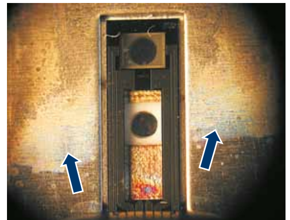
Consecințele curățării cu aer comprimat

În stânga: Folia pe care sunt aplicate elementele senzorului a fost complet „spartă”.