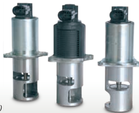
Vizualizare produs (extras)

Sub rezerva modificărilor textelor și ilustrațiilor. Pentru corespondența și înlocuirea pieselor consultați cataloagele valabile, CD-urile TecDoc și sistemele bazate pe datele TecDoc.