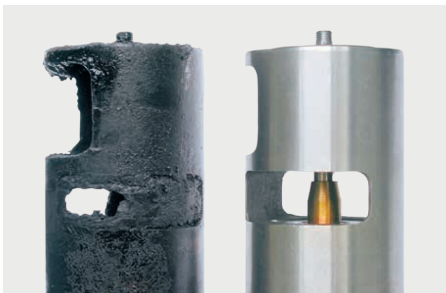
Supapă EGR blocată și în stare nouă

Pentru observații referitoare la diagnoză și cauze posibile → consultați paginile următoare