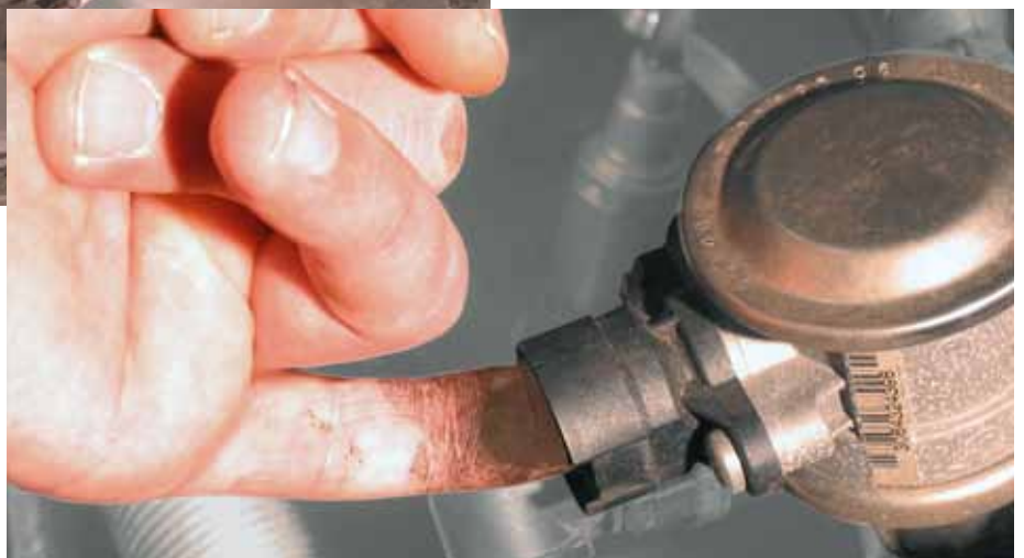
Sneltest aan secundaireluchtclep in BMW 520i (geaccentueerd)