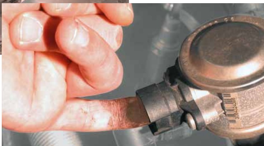
Lyntjek af sekundærluftventil i BMW 520i (fremhævet)