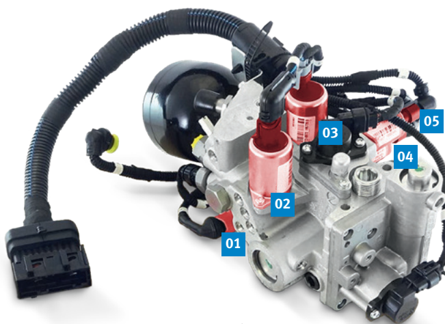
01-05 Pięć zaworów sterujących (zaznaczonych na czerwono) w skrzyni biegów Selespeed

Dlatego zaworów sterujących nie wolno zamieniać między sobą.