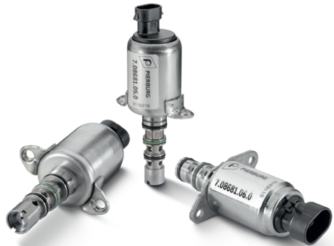
Zawory sterujące (przykłady z oferty)

W przypadku tych skrzyń przełączanie biegów odbywa się za pomocą przycisków przy kole kierownicy lub dźwigni wyboru biegu. W zależności od żądania kierowcy oraz takich parametrów, jak prędkość obrotowa, obciążenie i ustawienie pedału gazu, zawory sterujące kierują strumień oleju do różnych kanałów, co powoduje hydrauliczne włączanie sprzęgła i wybranego biegu – pedał sprzęgła nie występuje.