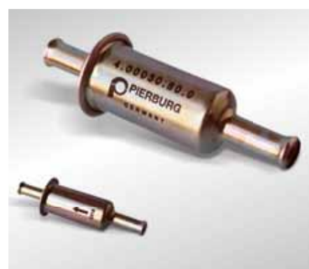
Náhled na produkt 4.00030.80.0

! Palivové čerpadlo E1F je dodáváno s malým palivovým filtrem na straně sání (v sacím hrdle, vstupu). Při provozu na benzín může tento filtr zůstat v čerpadle. Při provozu na naftu musí být tento filtr odstraněn, jelikož při nižších teplotách se zvyšuje hustota paliva a může docházet k problémům.